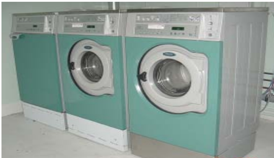
De nye lækre vaskemaskiner er lette at betjene.

Vaskeriet har åbent hele året - dagligt fra 10 – 22. Der er to vaskemaskiner beregnet til 7 kg og en stor tørretumbler. Det koster 25 kr. for en vask incl. sæbe & skyllemiddel og 25 kr. for en tørring. Vaskeriet befinder sig i sidebygningen - altså til højre for indkørslen. Poletter til maskinerne fås ved henvendelse i restauranten.