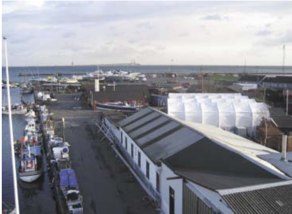
Dragør havn - hvad nu?