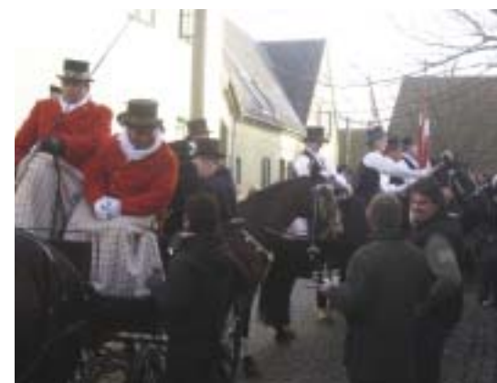
Fastelavnsrytterne var i år bl.a. i Lodsstræde 5 til punch.

Det er godt nok for sent i år - men så har I den næste år!